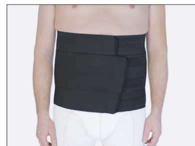
ViraKing - nur in schwarz, gröÙe 2-3XL.